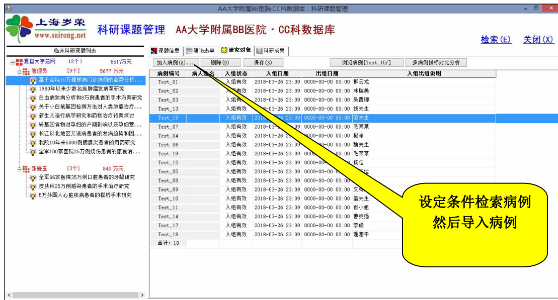
课题的研究对象——课题与病例关联-研究场景的设计