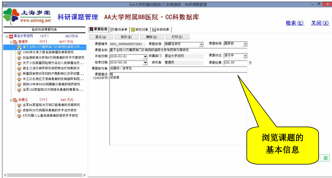
课题库主界面：课题基本信息